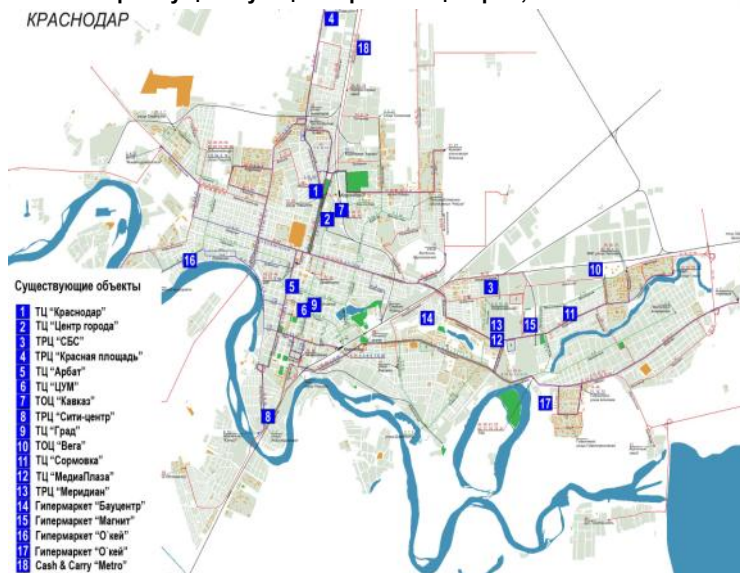
Карта существующих торговых центров, июнь 2008 г.

Планируемые торговые центры представлены следующими объектами: ТЦ «Power Center» в районе аэропорта, ТЦ «Екатеринодар» в центре города. Компания «Инпром-Estate» планирует строительство торгового центра, ИСК «Модус» будет заниматься строительством торгово-развлекательного центра «Модус» и другие.