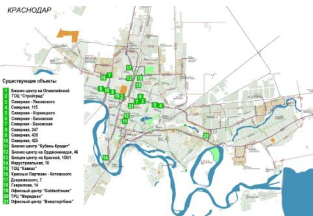
Расположение основных существующих офисных объектов класса «В», май 2008

Объем офисных помещений класса «В» составляет 96 561 кв. м. Основные существующие объекты в этом классе: «Венский дом» (общая площадь 7 400 кв. м), «Кубань-Кредит» (15 000 кв. м), бизнес-центр на Олимпийской (5 000 кв. м), офисный центр на пересечении улиц Красноармейской и Кузнецкой (5 000 кв. м). Здания класса «А» в настоящий момент на рынке не представлены.